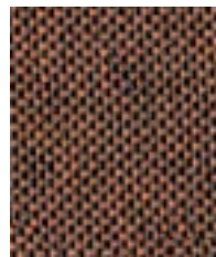
Deep Clay EGL32