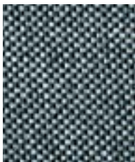
Deep Sea EGL48