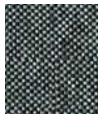
Grey Brindle EGL50