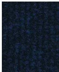
Navy Blue PRT03