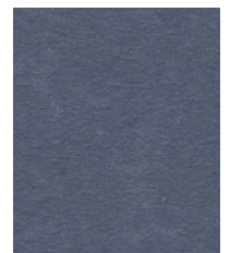
Squirrel Grey MMT12