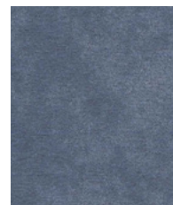
Slate Blue MMT13