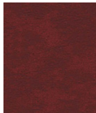
Burgundy Red MMT16